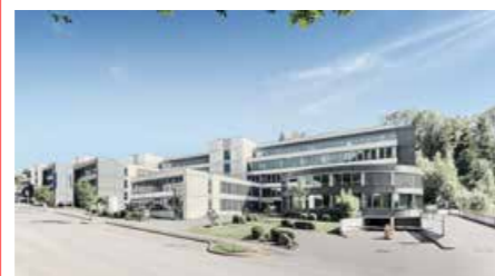
Le complexe de bureaux IKAROS 2.0.

Au sein du complexe de bureaux IKAROS 2.0 , l'État luxembourgeois vient de louer une superficie d' environ 17.000 m² répartie sur les 2 bâtiments Artemis et Apollo.